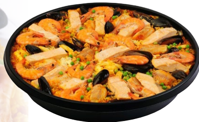
PAËLLA ROYALE (POULET, POISSON, FRUITS DE MER) | Poêlon de 6 kg.