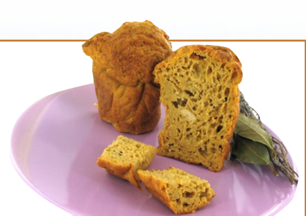
SOUFFLÉ TOMATES PESTO