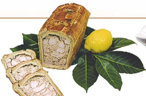
PÂTÉ CROÛTE POULET CITRON/MOUTARDE