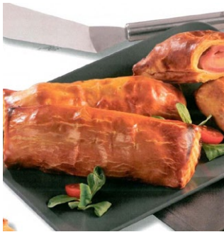
ROULEAU AU JAMBON