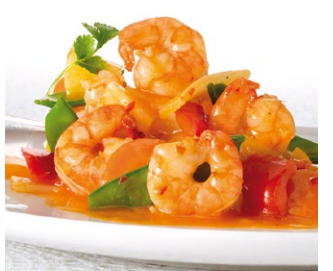
GAMBAS AIGRE DOUX