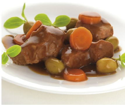
CIVET DE PORC AUX OLIVES VERTES | Poche de 2.070 kg.