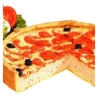
QUICHE AU THON ET AUX TOMATES FRAICHES