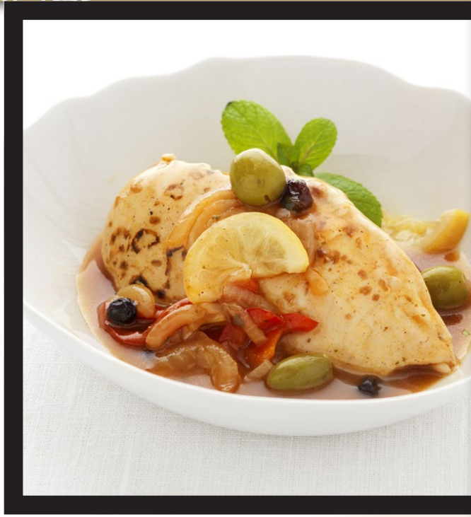
TAJINE DE POULET CITRONNÉ AUX OLIVES ET POIVRONS | Poche de 2.720 kg.