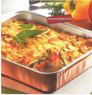
GRATIN AUX LÉGUMES DU TIAN