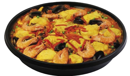
PAËLLA VALENCIANA | Poêlon de 6 kg.