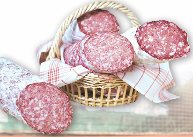
ROSETTE | Pièce de 2.5 kg.