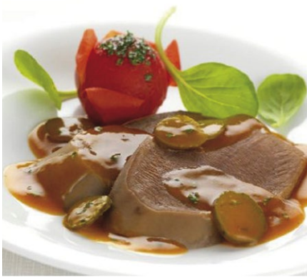
LANGUE DE BŒUF SAUCE PIQUANTE | Poche de 2.4 kg.