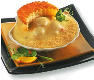
COQUILLE ST JACQUES A LA NORMANDE X8