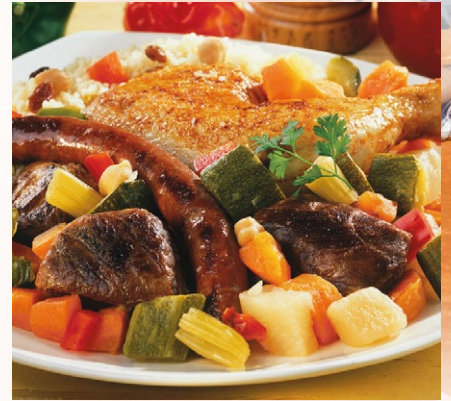
COUSCOUS COMPLET (VIANDE + LÉGUMES + SEMOULE) | Poche de 6.050 kg.