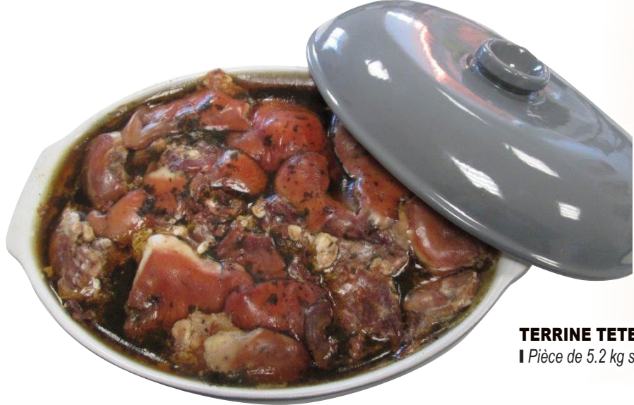
TERRINE TETE DE COCHON | Pièce de 5.2 kg s/v.