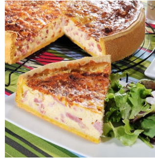
QUICHE LORRAINE CLUB