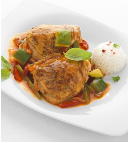
POULET BASQUAISE | Poche de 2.560 kg.