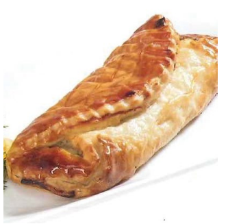
FEUILLETE RIS VEAU ET FOIE GRAS X8