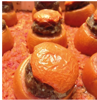
TOMATE FARCIE ET SON RIZ X15