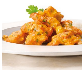
POULET TIKKA MASSALA