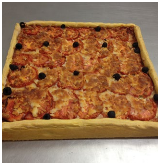
PIZZA PLAQUE 60 X 40