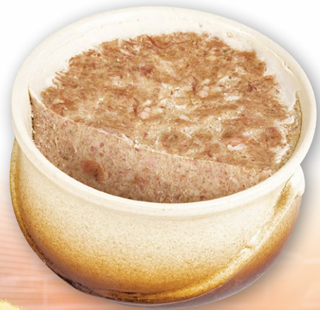
RILLETES DU MANS AU JAMBON | Terrine flamée grés 3.000 kg.