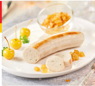
BOUDIN BLANC GRANDE HERMINE A L ANCIENNE