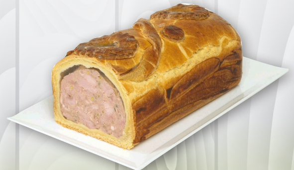
PATE CROUTE PATISSIER NOIX DE VEAU