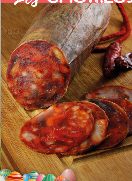
CHORIZO À GRILLER FORT /DOUX