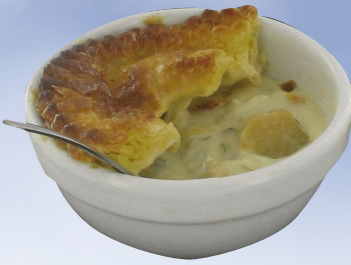
CASSOLETTES NOIX SAINT JACQUES ET POIREAUX | 0,170 X4.