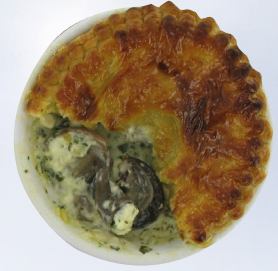
CASSOLETTES D'ESCARGOTS A LA CREME