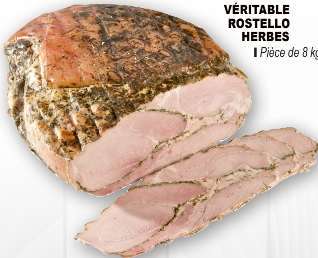
VÉRITABLE ROSTELLO HERBES | Pièce de 8 kg.