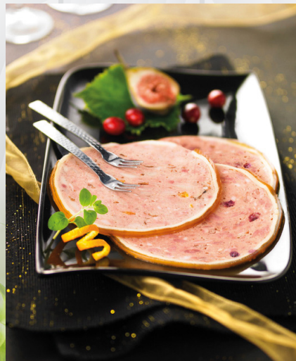
BALLOTTINE DE VOLAILLE CHAMPI- GNONS | 2KG900.