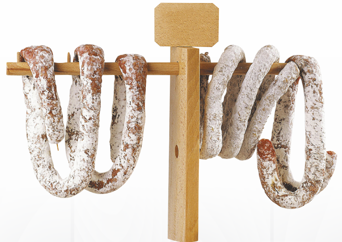
LA TOURNÉE | Pièce de 2.5 kg.