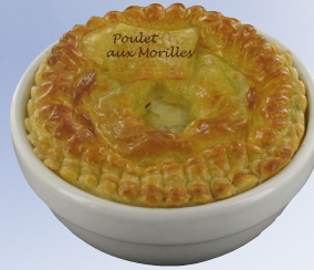
CASSOLETTES POULET DE BRESSE AUX MORILLES