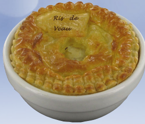
CASSOLETTES RIS DE VEAU CHAMPIGNONS A LA CREME | 0,170 X 4.