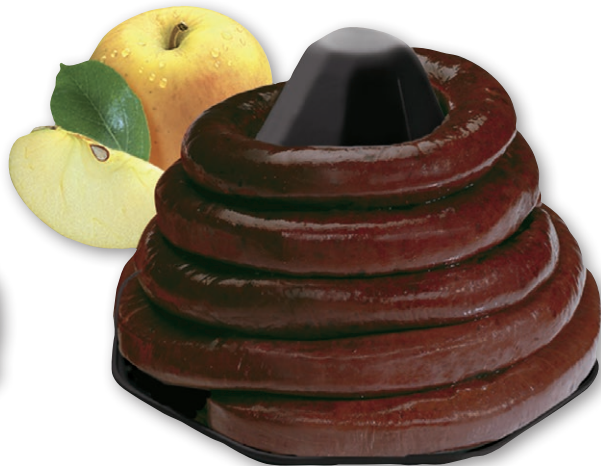
BOUDIN NOIR POMMES