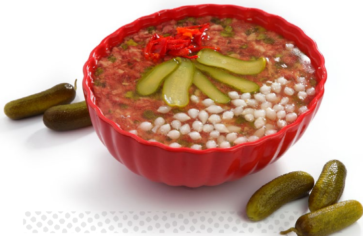
DÉLICE DE TÊTE AUX CORNICHONS SALADIER ROUGE Pièce de 4.600 kg