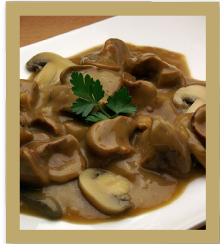
ROGNONS DE PORC SAUCE MADÈRE ET CHAMPINONS DE PARIS Barquette de 1.800 kg