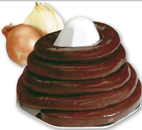
BOUDIN NOIR OIGNONS