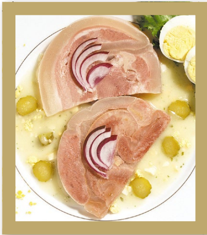
TÊTE DE VEAU SAUCE GRIBICHE Barquette de 3.100 kg