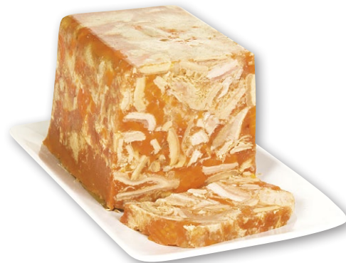
TRIPES À L'ANCIENNE MIJOTÉES 20 HEURES AU CIDRE ET AU CALVADOS Pain sous vide de 3 kg.