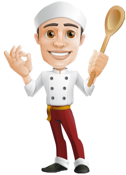
ALIGOT THÉRONDELS Barquette de 2 kg