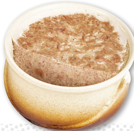
RILLETES DU MANS AU JAMBON Terrine flammée grès 3.000 kg