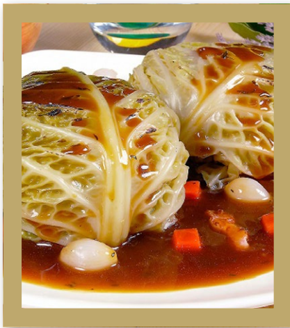
CHOUX FARCIS ET SON JUS AU THYM Barquette de 1.800 kg