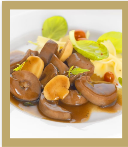
ROGNONS DE PORC SAUCE MADÈRE Poche de 2.400 kg