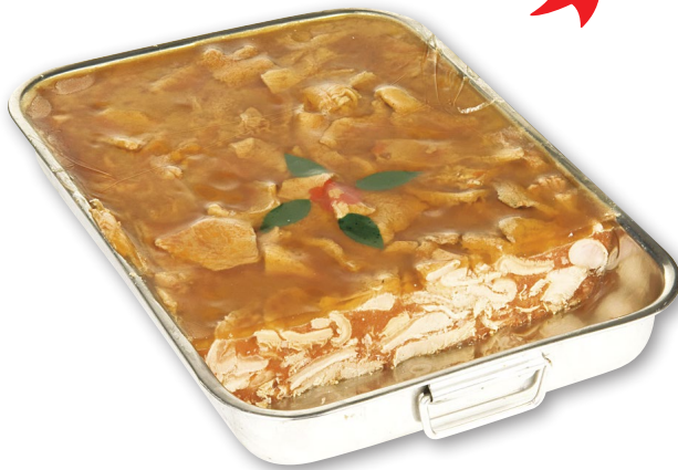
TRIPES À L'ANCIENNE MIJOTÉES 20 HEURES AU CIDRE ET AU CALVADOS Plat inox rectangulaire avec poignées de 7 kg.