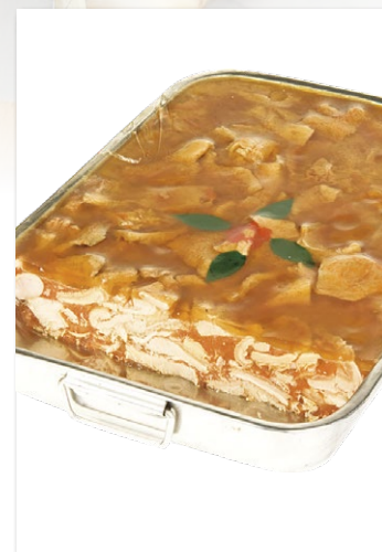
TRIPES A LA MODE CAEN PLAT INOX