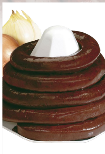
BOUDIN NOIR À L'ANCIENNE AUX OIGNONS BRASSE