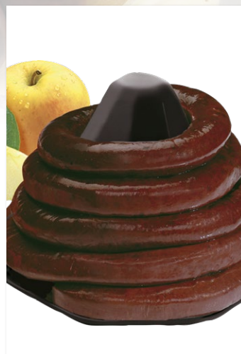
BOUDIN NOIR À L'ANCIENNE AUX POMMES BRASSE