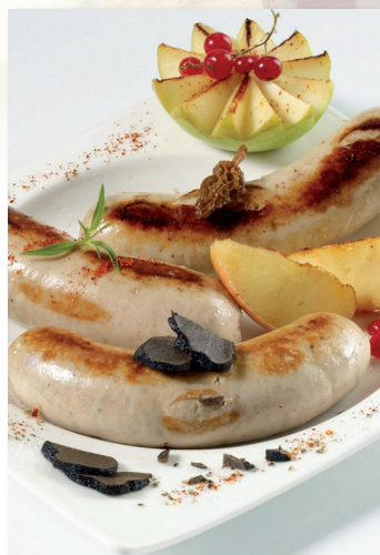
BOUDIN BLANC "GRAND HERMINE"