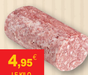
TÊTE ROULÉE SANS LANGUE BARDÉE Pièce de 2.6kg.