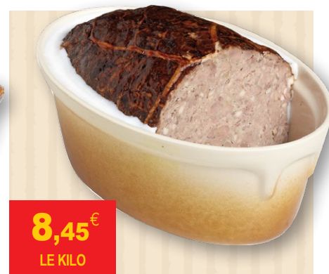
TERRINE DE CAMPAGNE CAMPA'FOUR À L'ANCIENNE Pièce de 3.4 kg.