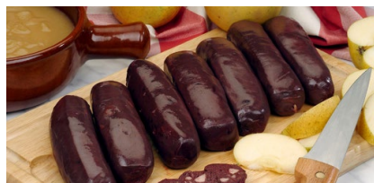
BOUDIN NOIR À L'ANCIENNE AUX POMMES BRASSE