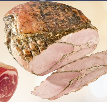
VERITABLE JAMBON ROSTELLO