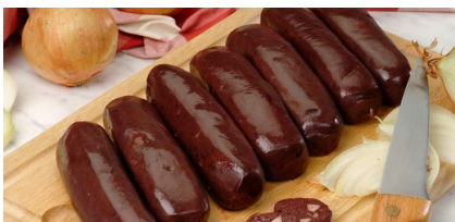
BOUDIN NOIR À L'ANCIENNE AUX OIGNONS BRASSE