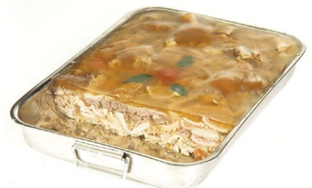
TRIPES A LA MODE CAEN PLAT INOX I 1PIECE.