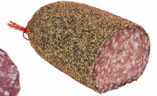
PAVE AUX POIVRES