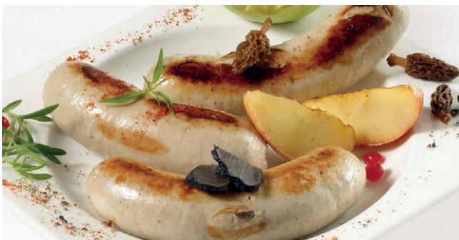
BOUDIN BLANC "GRAND HERMINE" I X18.