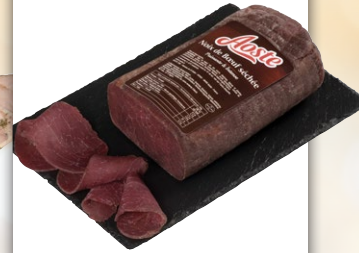
NOIX DE BŒUF I 1KG500.