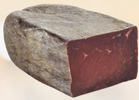
VIANDE DE GRISON